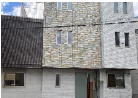
「キッズパートナー文京千石」外観