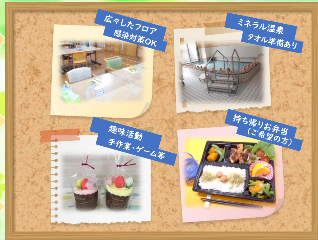
広々したフロア 感染対策OK